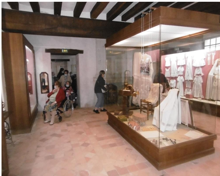
Musée des Métiers à St Laurent de la Plaine

Une succession de façades, de places anciennes, rues pavées et des charpentes audacieuses construites dans la tradition abritent ateliers et collections, 35 métiers y sont représentés dans leur réalité d'autrefois par l'objet et outils issus des métiers de la pierre, du bois, de la terre du textile et du cuir ... Les collections nous plongent dans l'univers de l'artisanat et du monde rural au début du XXe siècle, avec des rues pavées qui nous invitent à une balade dans un ancien village de l'Anjou.