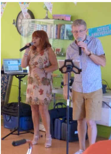
Fête des anniversaires avec le groupe « Chante et danse », le 21 septembre