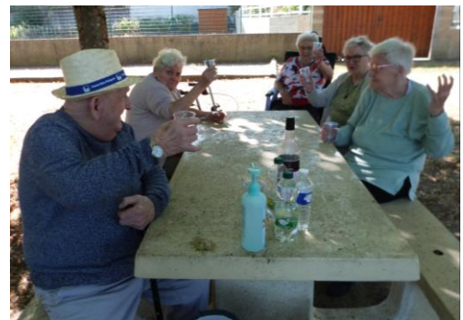
Montreuil sur Maine, au bord de la rivière, le 23 septembre.