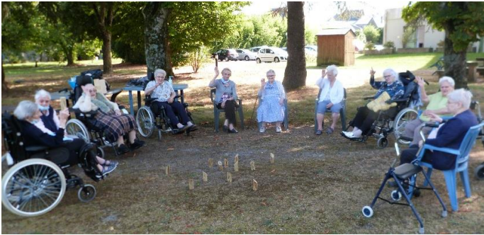
Mölkky dans le parc, le 13 septembre