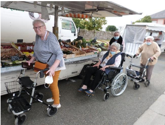
Marché de Bécon-les-Granits, le 16 septembre.